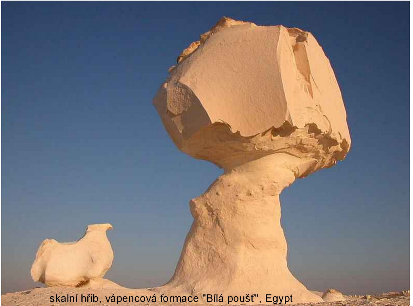
skalní hřib, vápencová formace "Bílá poušť", Egypt