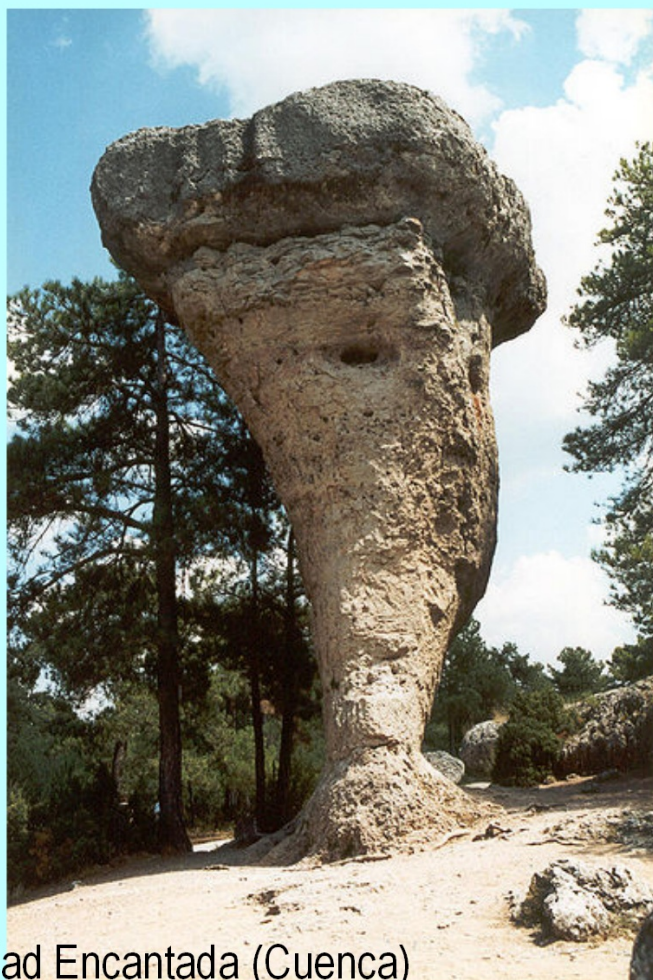
skalni hřib, Ciudad Encantada (Cuenca)